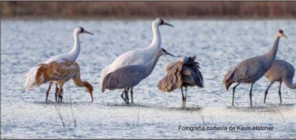
Un humedal restaurado atrae a las grullas trompeteras Desde que se restauraron las praderas y los humedales del lugar, innumerables animales salvajes han visitado la reserva forestal de Muirhead Springs. En 2024, una familia de grullas trompeteras en peligro de extinción hizo escala allí.

Observatorio de vida silvestre de varios niveles La reserva forestal Muirhead Springs es el sitio de la restauración de humedales más grande del distrito. Poco después de crear el humedal en medio de la pradera circundante, el sitio se convirtió en un lugar de interés para la observación de aves. Un observatorio de varios niveles permitiría al público obtener una mejor vista de todo el sitio y de la vida silvestre que acude a esta reserva.